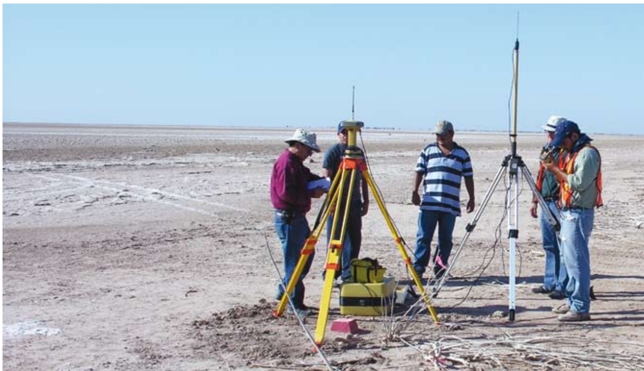
Equipo de investigación instalando y nivelando puntos de elevación de referencia en la parte oeste de la Ciénega

tallado. Si los fondos están disponibles, el protocolo se podría modificar para aumentar la cobertura al incrementar la cantidad de puntos de estudio.