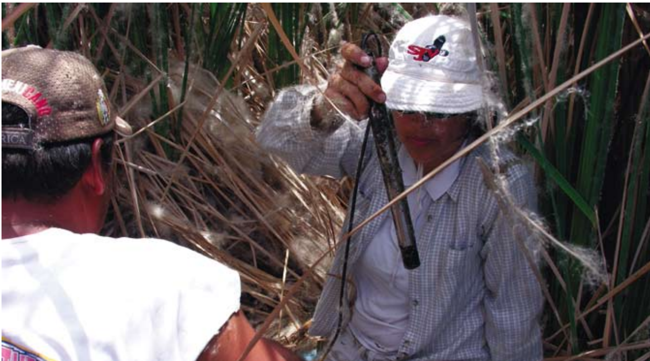
Transfiriendo datos de los sensores de conductividad instalados en la Ciénega

Los parámetros principales (temperatura, pH, oxígeno disuelto y conductividad) se pueden medir mensualmente con medidores de parámetros múltiples en los 21 sitios de muestreo. Para grabar los datos, la sonda deberá ser colocada cerca de la superficie y en medio de la columna del agua. La sonda será examinada, calibrada, inspeccionada y