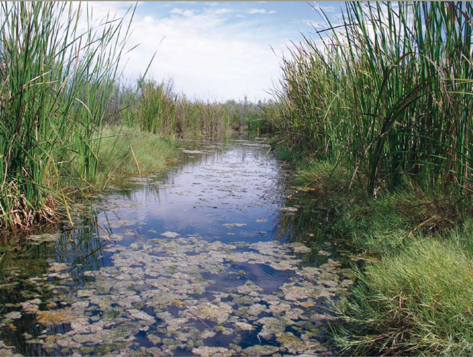
Acceso a la Ciénega por la parte este, localmente conocido como entrada Flor del Desierto