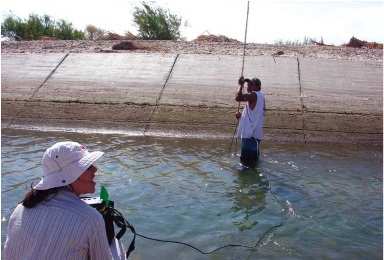
Midiendo flujos de agua en el canal Wellton

Mediciones manuales de flujo. Los flujos en los puntos de descarga se pueden calcular usando un instrumento de medición de flujo; sin embargo, no es práctico hacerlo diariamente de esta forma. El mé-