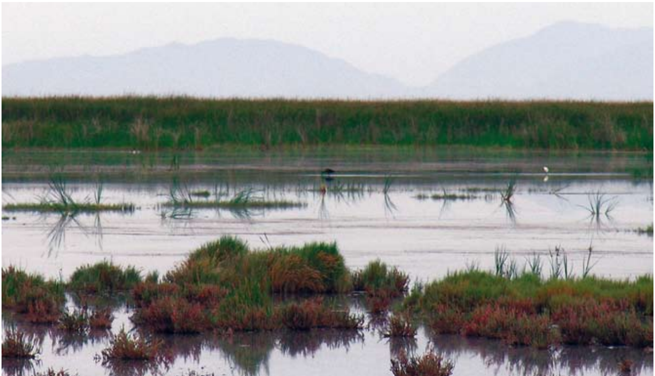
Porción oriental de la Ciénega

Los datos topográficos y batimétricos existentes para la Ciénega y las áreas que la rodean son de baja resolución. Como mínimo se necesita una caracterización básica de las condiciones topográficas y batimétricos como línea base y para poder evaluar los posibles impactos en los humedales bajo diferentes condiciones de flujo. El siguiente protocolo está diseñado como un estudio básico. Sin embargo, se espera que sea muy valioso para determinar si se necesita un estudio más de-