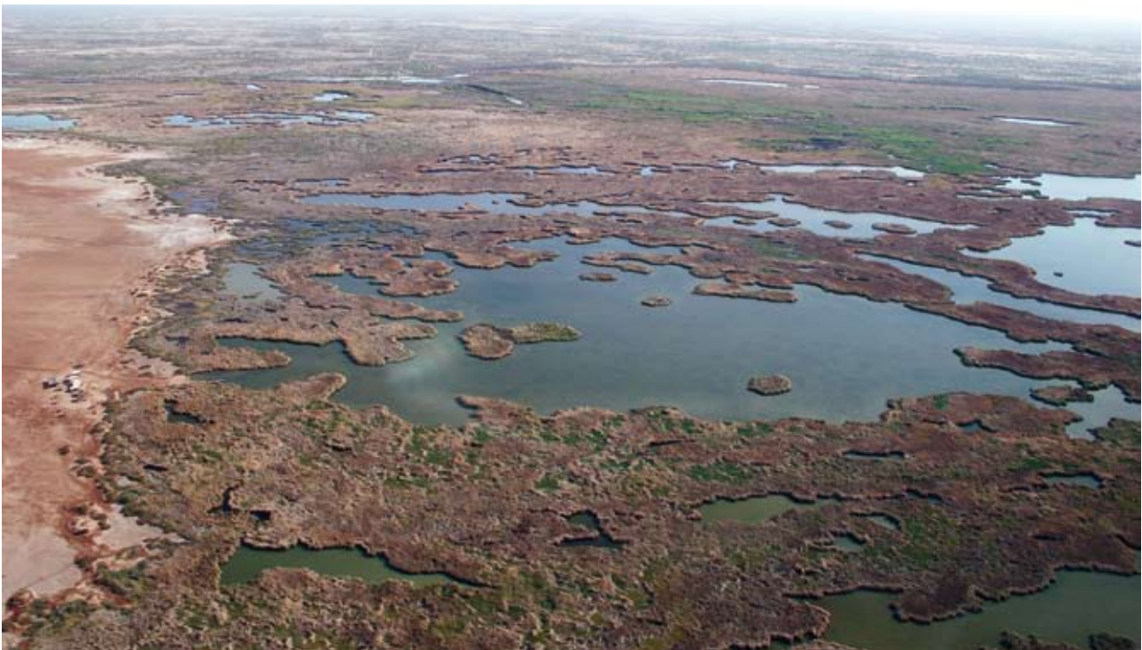
Vista aérea de la porción norte de la Ciénega mostrando la zona de lagunas y las instalaciones de ecoturismo

En general, el protocolo consiste en estudios de respuesta a vocalizaciones, en los que las vocalizaciones grabadas son transmitidas para obtener respuestas de las aves de marisma en cuestión. En cada punto de estudio, los observadores registran el número de aves que responde de cada especie durante un período pasivo de 5 minutos antes de