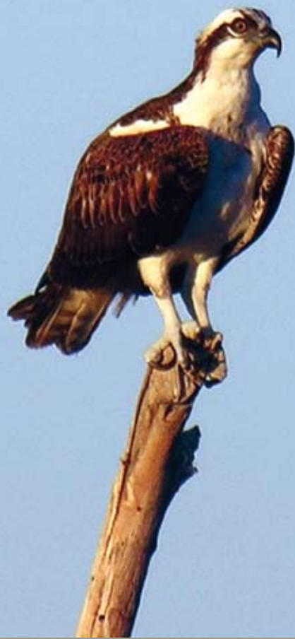
Águila pescadora, un visitante frecuente de la Ciénega de Santa Clara