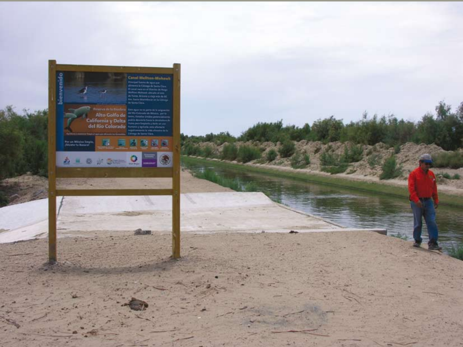
Canal Wellton y su vertedor construido recientemente cerca del punto de descarga a la Ciénega