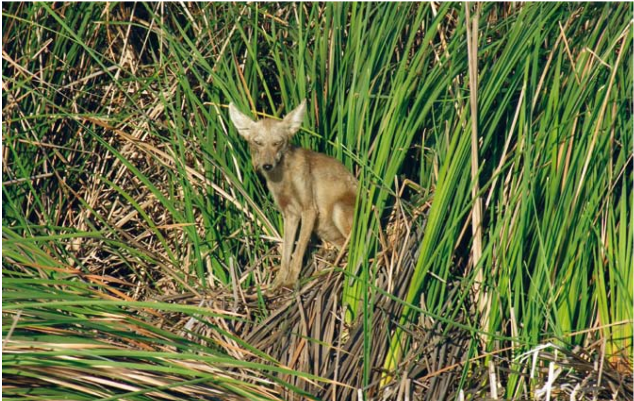
El tule es la principal especie de vegetación en la Ciénega y provee hábitat para muchas especies de aves y otra fauna

sitios conocidos. Si tal es el caso, pero la información no está aún disponible, no se recomienda repetir estos estudios, ya que existe la posibilidad de perjudicar la población de los peces cachorrito del desierto en la Ciénega debido a la manipulación o contacto excesivo con la especie.