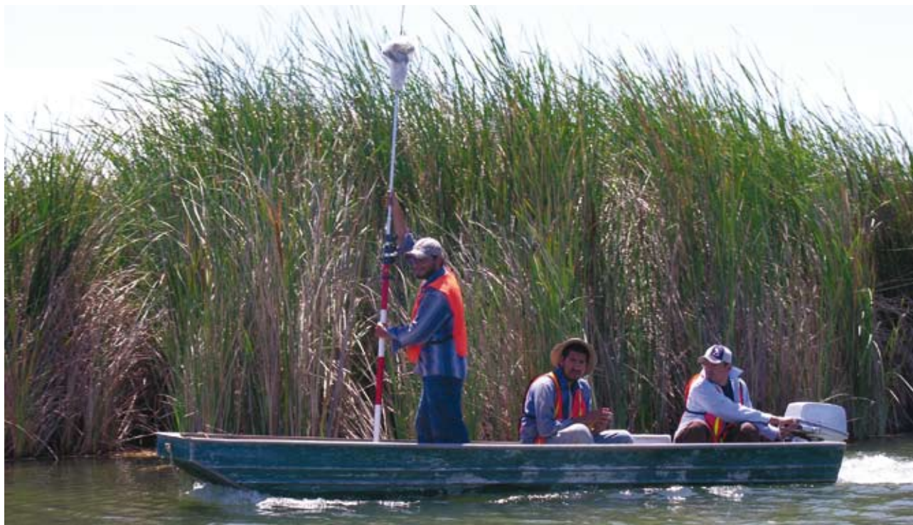
Personal de la UABC durante el reciente levantamiento topográfico

Los parámetros básicos del clima local, tales como temperatura, viento, evaporación y humedad serán útiles para interpretar los datos del programa de monitoreo. A pesar de haber una estación meteorológica ubicada a aproximadamente 15 millas de la orilla norte de la Ciénega, se recomienda instalar una estación meteorológica básica en la misma Ciénega. Una estación meteorológica compacta y económica (menos de $2,000 dólares) proveerá información para la misma Ciénega y garantizará el acceso a datos meteorológicos.