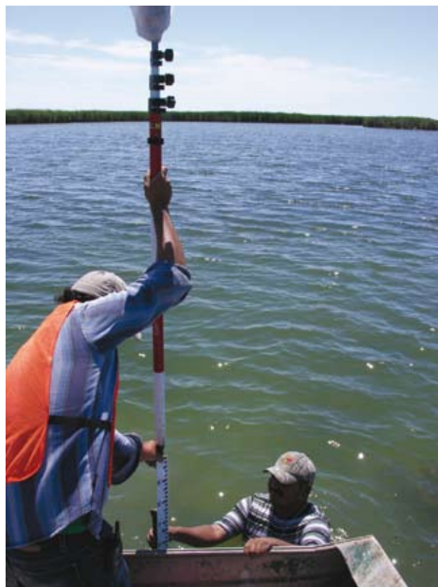
Instalación de regletas para medir nivel del agua en la Ciénega

Un medidor de nivel de agua de presión será instalado en el mismo lugar en el que se toman las medidas manuales. Se configurará el medidor para tomar medidas cada hora. Los datos del medidor serán descargados y analizarán una vez al mes. El gasto o flujo se obtendrá usando la ecuación de regresión de la curva de calibración. Después, estos cálculos de flujo serán comparados con los datos de IBWC/CILA y CONAGUA.