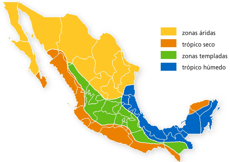
Figura 1. Regiones ecológicas

Las siguientes tablas definen los criterios técnicos que debe cumplir el proyecto del Desarrollo Habitacional Sustentable. Se catalogan por ámbito de aplicación que puede ser Regional (R), según las características de la localidad, o bien General (G), aplicable en cualquier localidad. Las ponderaciones permitirán cuantificar el grado de cumplimiento del criterio establecido.